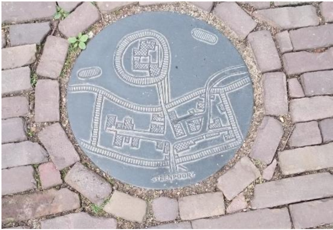
Afb. 2. Visualisatie stadspoorten gemeente Bronkhorst