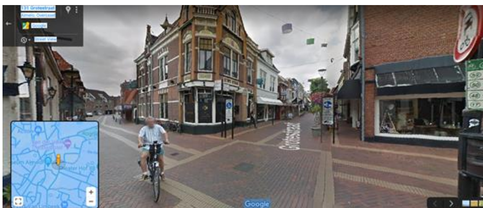
Afb 4. Zuidelijke stadspoort