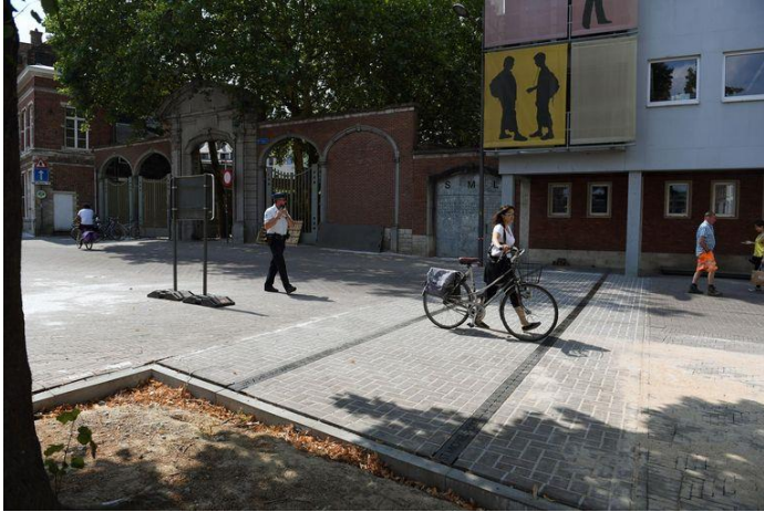
Afb. 1. Voorbeeld visualisatie stadspoort in Leuven